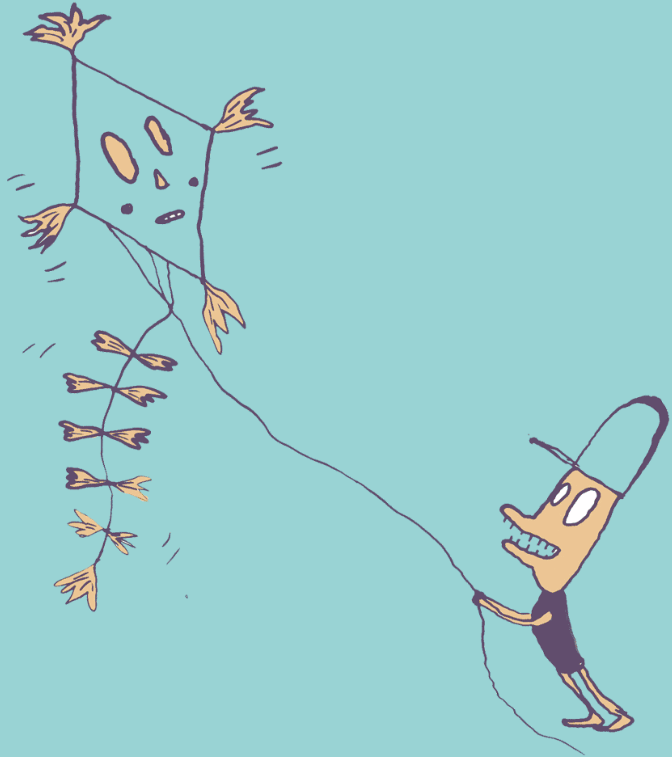
Das Projekt wird finanziert aus den Programmmitteln „Jugendarbeit an Schule“ der Senatsverwaltung für Bildung, Jugend und Wissenschaft in Berlin in Kooperation mit der Jugendförderung des Bezirks Friedrichshain/ Kreuzberg und der Justus von Liebig Grundschule.

Unsere Ziele sind Mitbestimmung, die Stärkung von Teamfähigkeit, Ausdauer und Neugierde.